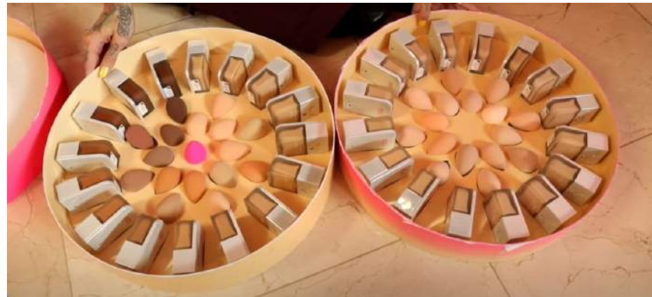
Image courtesy | Jeffree Star Youtube : SHADE RANGE WHO?? THE TRUTH ABOUT THE BEAUTY BLENDER FOUNDATION