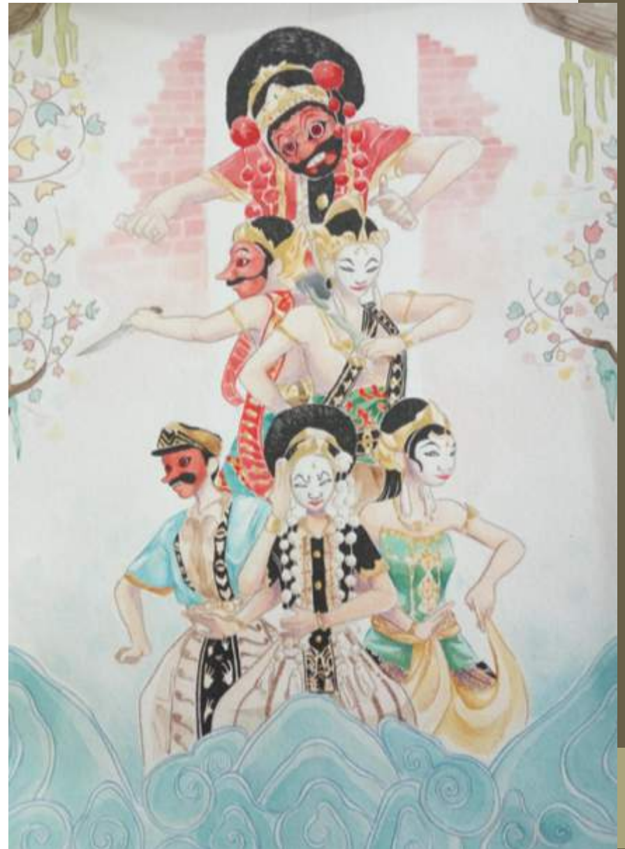
DG 2016 – ilustrasi poster budaya Cirebon