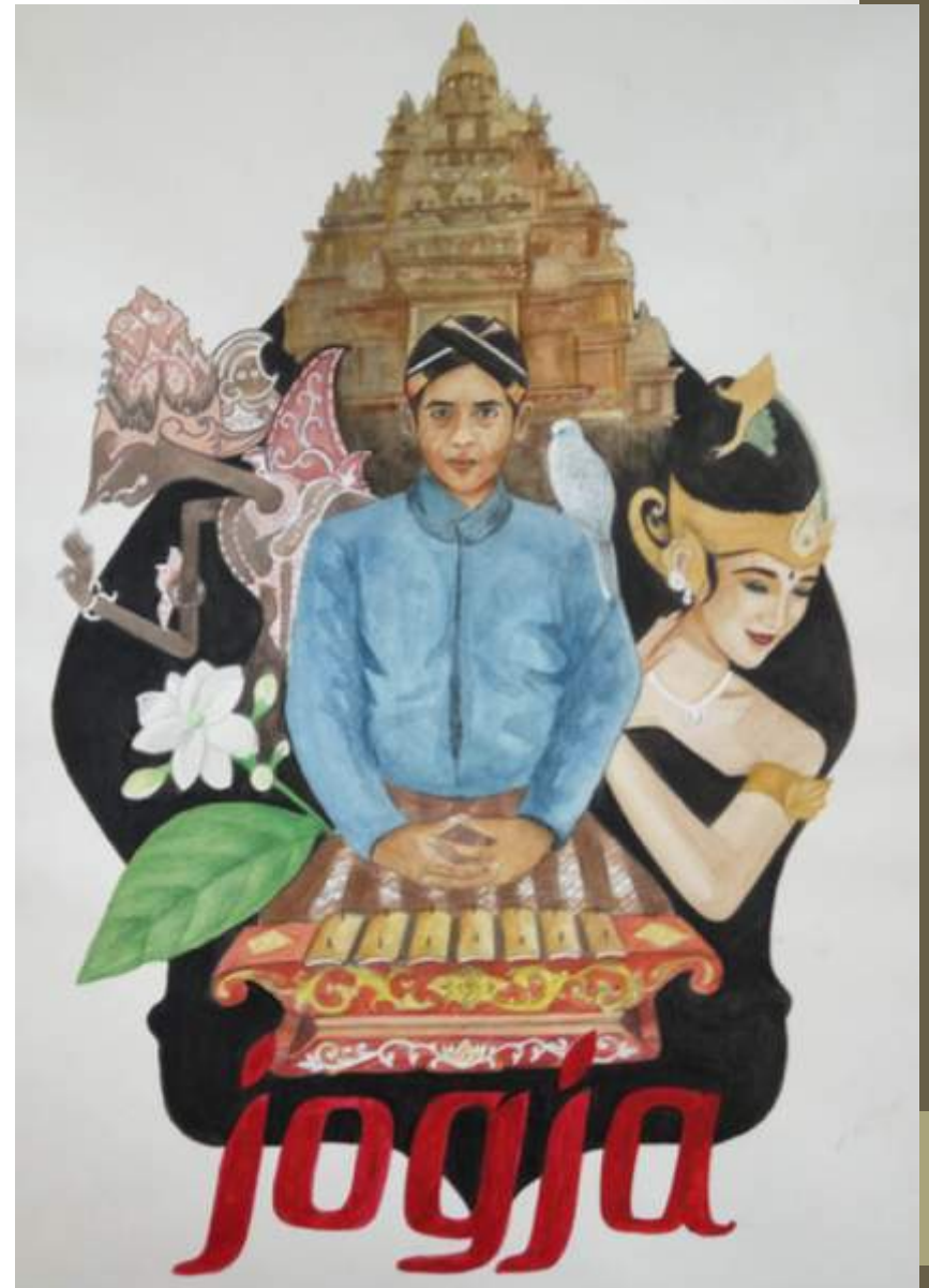
DG 2016 – ilustrasi poster budaya di kota Lombok & kota Jogja